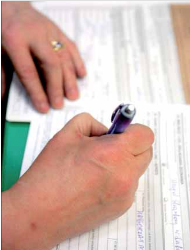
Pierwsze PIT-y już od wczoraj spływają do urzędów skarbowych

– Jeśli wypełnimy PIT-12, cedujemy tym samym rozli-