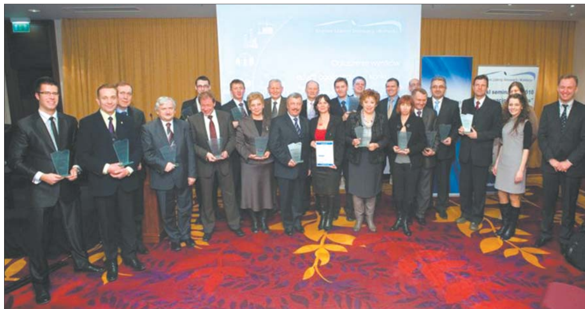
Laureaci ubiegorocznego ogólnopolskiego finału konkursu Krajowi Liderzy Innowacji i Rozwoju

Szczególnie wysoko jury konkursu zamierza nagradzać organizowanie konferencji i publikacje wspierające przedsiębiorczość.