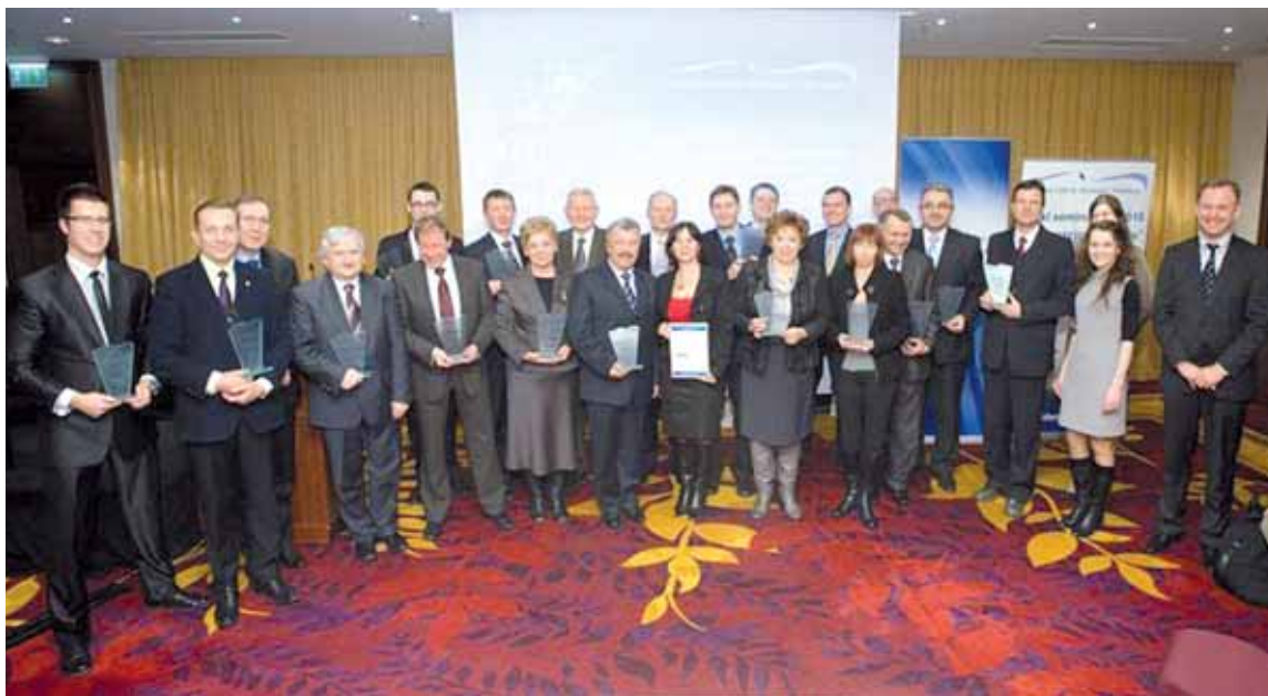
Laureaci ogólnopolskiego finału konkursu Krajowi Liderzy Innowacji i Rozwoju 2010